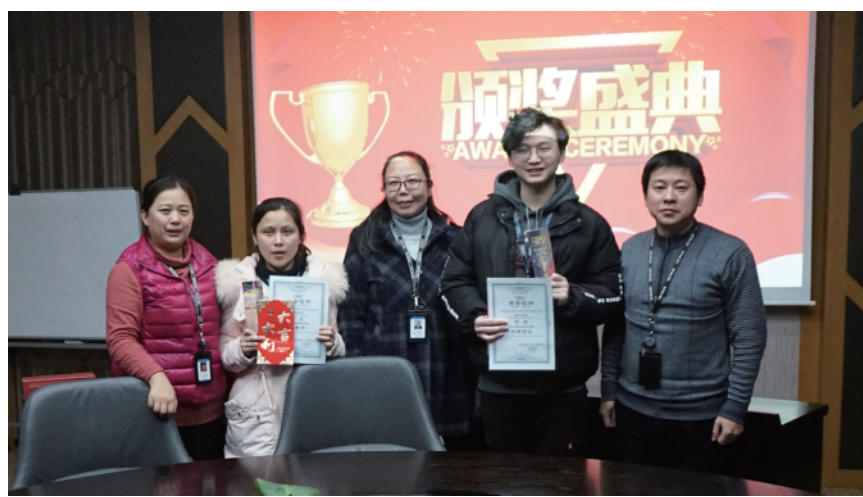
夏总、王总及额总为获奖人员颁奖

最后额总表示一年来各位同事努力工作，代表公司感谢大家的辛勤付出，并对大家的成绩表示赞赏，希望2019年大家有坚如磐石的信心，只争朝夕的劲头，坚韧不拔的毅力，撸起袖子加油干。争取2019年再创辉煌。